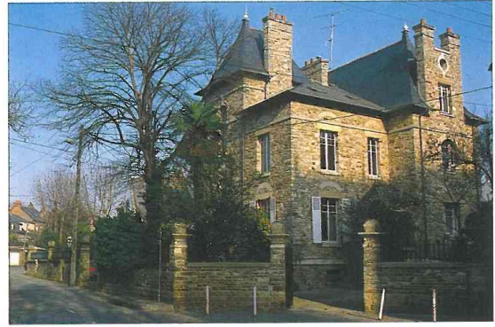
Villa Oberthür, 87, 89, rue de Paris, rue Vatar, 1913, Ch. Couâsnon architecte. Façade du 89, rue de Paris.

(Voir les numéros 61 et 63 rue de la Palestine, œuvres des architectes J. Gallacier et H. Perrin, en 1912.)