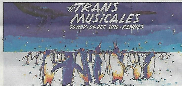
Un peu partout dans la ville, on peut découvrir ses œuvres, comme ici, rue Victor-Hugo. L'œuvre de War ! acquise par la Ville de Rennes sera visible cet été. War a réalisé l'affiche des deux dernières éditions de Trans Musicales.