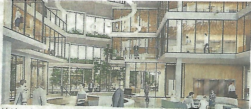
L'atrium dans le futur siège de Samsic.