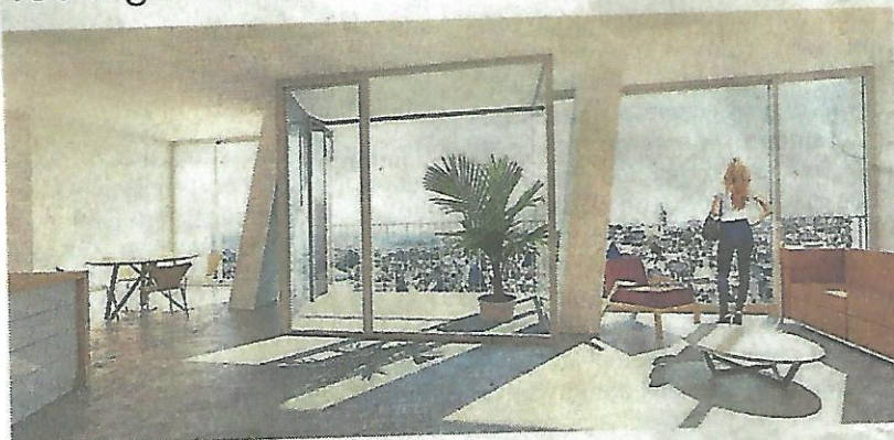
Chaque appartement disposera d'un jardin d'hiver.

180 logements, dont 28 en accession sociale