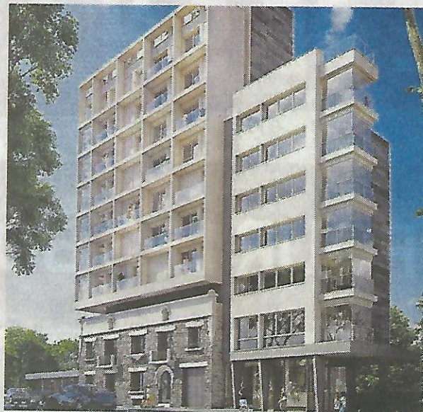
Cette résidence haut de gamme sera composée de vingt appartements, du T1 au T5. Au rez-de-chaussée, le projet intègre la façade de la maison actuelle, qui date des années 1920.